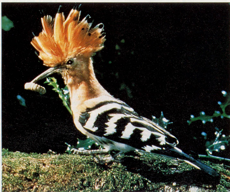
Ein Wiedehopf im Parc National des Cévennes

In Berlin haben sich ältere Frauen und Männer aus allen Stadtteilen zusammengefunden, um auswärtigen Besuchern ihre Stadt zu zeigen. Im Prospekt der Gruppe heisst es: «Überraschungsrouten sind unsere Spezialität. Jede(r) von uns möchte Ihnen (s)ein Stück Berlin näherbringen. Hier haben wir gearbeitet und unsere Kinder grossgezogen.» Damit bietet Berlin gerade für ältere Besucher eine zusätzliche Attraktion und die Möglichkeit, in dieser Grossstadt vielleicht neue Freunde zu finden. Für den Service wird eine geringe Aufwandentschädigung erhoben,