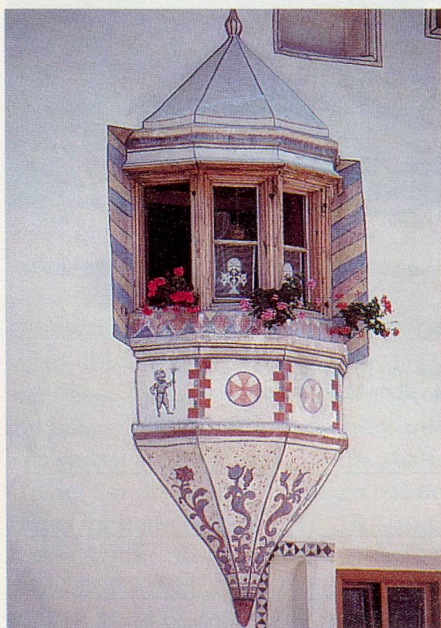
Erker der Chasa Jaura

Weltberühmt und sicher vielen Leserinnen und Lesern bekannt ist das im 8. Jahrhundert von Karl dem Grossen gestiftete Kloster St. Johann in Müstair mit seinen einzigartigen karolingischen und romanischen Wandmalereien. Das Kloster wird heute noch von Benediktinerinnen bewohnt. (Informationen über das Kloster finden Sie in verschiedenen Kunstführern, die im