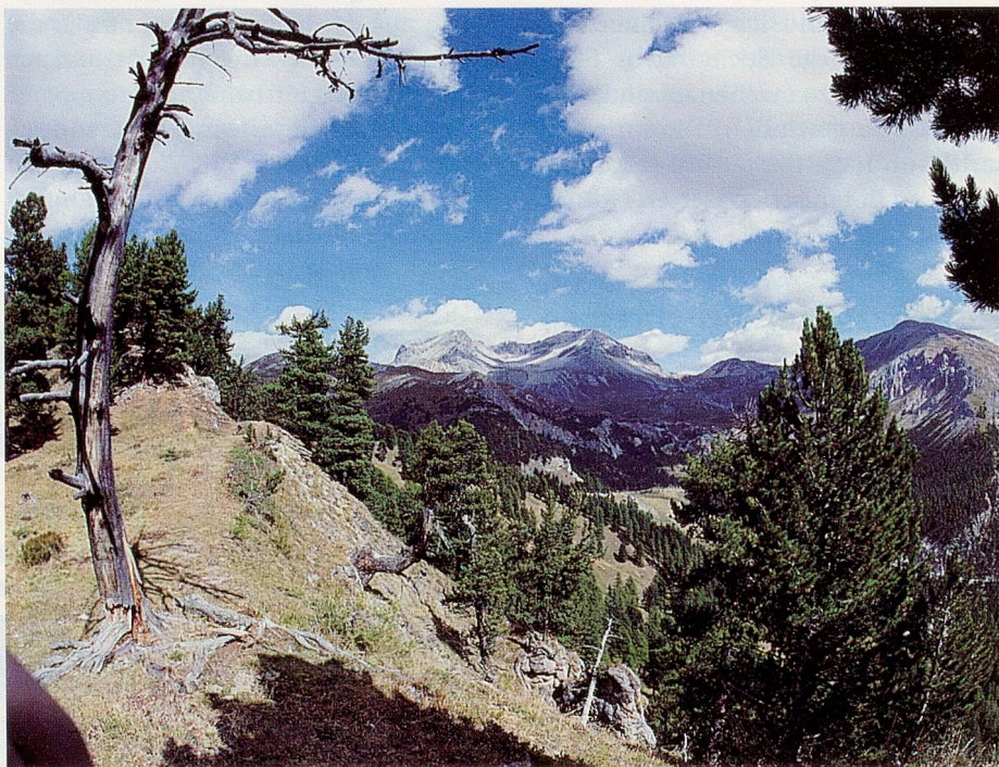
Auf der Wanderung vom Ofenpass nach Lü

D er Weg ins Münstertal, ins östlichste Tal der Schweiz, ist weit, doch die Reise lohnt sich. Und schliesslich kann man sich auf der Anreise schon bestens auf die Ferien einstellen. Die Fahrt mit den öffentlichen Verkehrsmitteln dauert zwar etwas länger, ist aber geruhsamer, lässt Zeit und Musse, die wunderschönen Landschaften zu betrachten, und mit einer Tageskarte der SBB reist man günstig. Wer ins Val Müstair kommt, sollte auf dem Ofenpass einen Halt einschal-