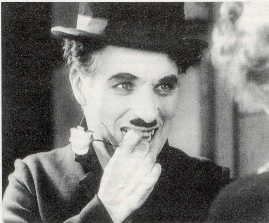
Charlie Chaplin in «Limelight»

Neville verliebt sich in die Ballerina, die ihrerseits aber eine wachsende Zuneigung zu Calvero empfindet. – Das ist die Ausgangssituation für einen der menschlich anrührendsten und bewegendsten Filme nicht nur von Charlie