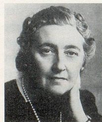
Zum «Erinnern Sie sich noch?» aus Heft 10/95

Aus den richtigen Antworten ziehen wir fünf Gewinner, unter welchen wir einen Blumenstrauß (gestiftet von Winterthur Leben) und vier Abonnemente der Zeitlupe zum Weiterverschenken verlosen.