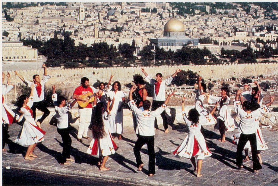
Jerusalem 3000: Israelische Volkstänze in der Stadt König Davids.