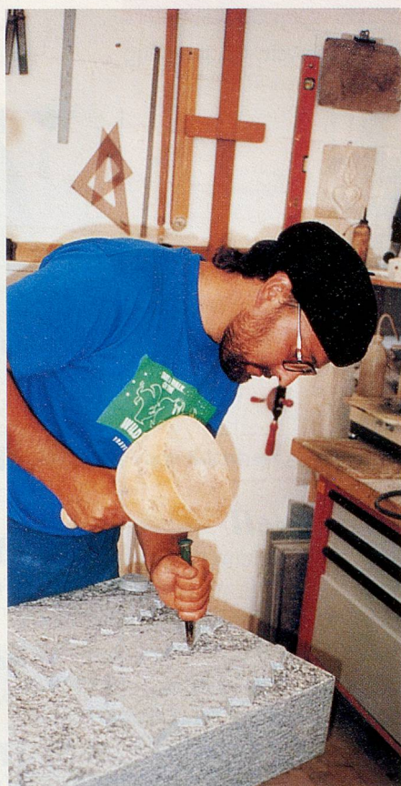
Grabmalkultur ist seit Urzeiten auch Menschheitskultur.

«Wir versuchen, den Hinterbliebenen eine gewisse Trauerarbeit abzunehmen, sie zu trösten. Verliert man einen geliebten Menschen, so vermisst man ihn. Ein Grabmal ist eben nicht nur eine Platte mit einem Namen darauf, sondern es greift in symbolischer Art etwas aus dem Leben des Verstorbenen heraus und macht damit den Friedhof