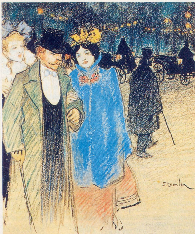
Nach dem Theater um 1900, Pastell und Tuschfeder von Théophile-A. Steinlen

Die Herbst-Ausstellung im Seedamm-Kulturzentrum Pfäffikon ist einem bedeutenden, hierzulande jedoch wenig bekannten Westschweizer Künstler gewidmet. Théophile-A. Steinlen wurde 1859 in Lausanne geboren, übersiedelte 1879 nach Mülhausen und 1881 nach Paris. Inmitten einer turbulenten Epoche errang er in seiner Wahlheimat Paris hohes Ansehen als Maler, Zeichner, Illustrator und Plakatgestalter. Nicht die Schönheit der Stadt und ihrer Denkmäler, sondern das Alltagsleben, die Sorgen und Nöte, aber auch die Freu-