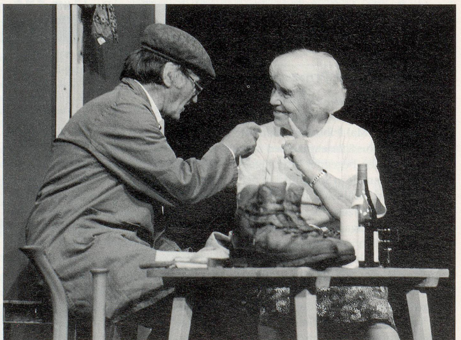
Seniorentheater Uttigen. «Mueters nöi Läbesphilosophie» nach der Erzählung von Bertold Brecht «die unwürdige Greisin».