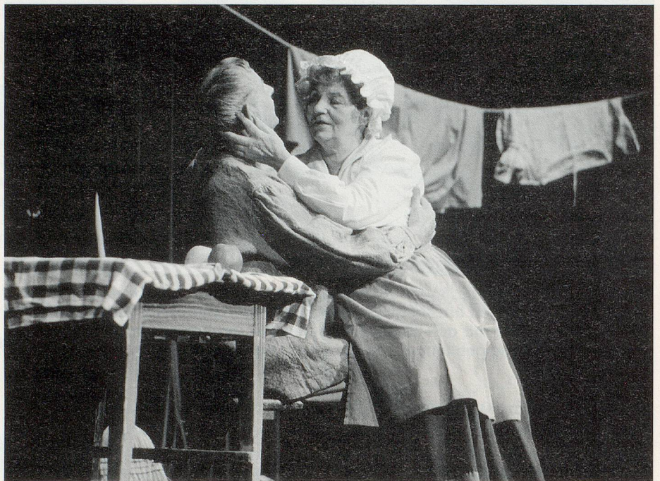
Seniorentheater «Zeitlos» aus Rathenow/Deutschland mit dem Hans-Sachs-Stück «Der tote Mann».