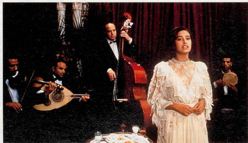
Das Schweigen der Frau – nicht nur im Islam: «Les silences du palais»

der Greuelthaten aktueller Kriegsgeschehen leicht vergessen wird, war ein Ereignis, das die europäische Geschichte unseres Jahrhunderts wesentlich geprägt hat. Er darf niemals vergessen werden. Diese «wahre» Geschichte ist aber auch ein Beispiel, dass es immer wieder auf den einzelnen ankommt, ob in der Welt Glück oder Leid herrscht.