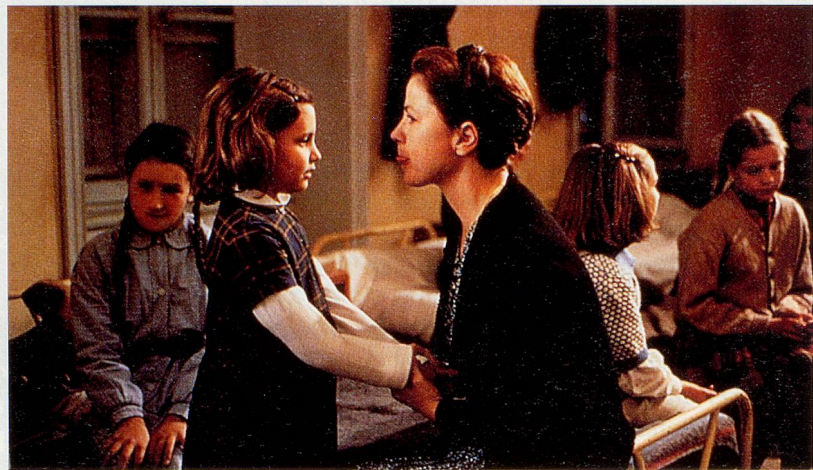
Ein Film gegen das Vergessen: «La Colline aux mille enfants»