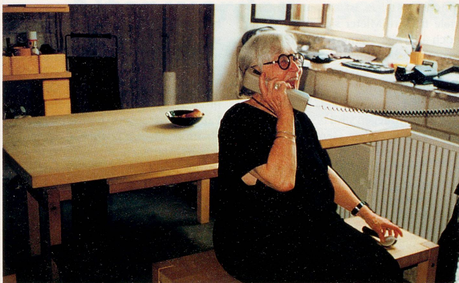
Lautes und fröhliches Lachen schallt vom Telefon her: «... Freude an der Sache ist das Allerwichtigste ...»

dezidiert spricht jetzt die kleine alte Frau. «Dafür kämpfe ich: Dass jeder Mensch lernt, selbst zu leben!»