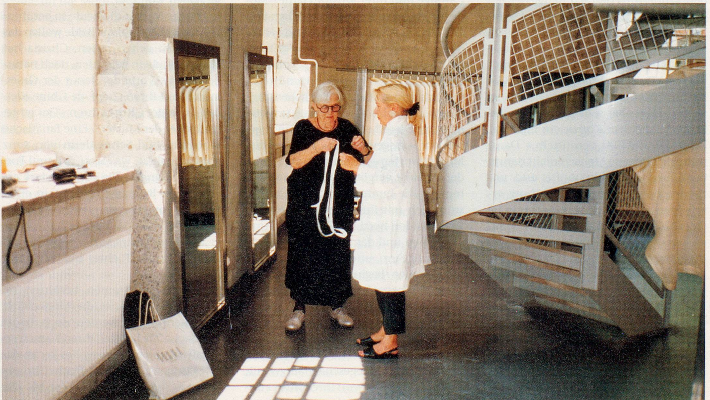
Mit 86 Jahren noch regelmässig im Geschäft: «... ich würde mir dann sagen, jetzt spare ich ein halbes Jahr lang, damit ich mir das leisten kann, was ich unbedingt haben möchte ...»