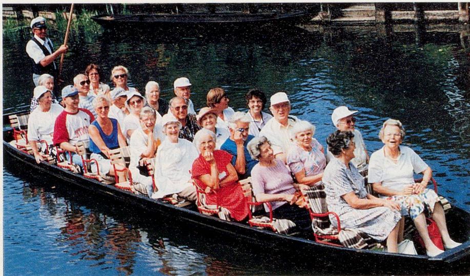
Nicht nur die Vertreter der sieben europäischen Länder sitzen im gleichen Boot – auch die Probleme der durch sie vertretenen Senioren sind ähnlich gelagert. – Teilnehmende an der 21. Berliner Seminarwoche auf einer Bootsfahrt im Spreewald in Berlin.