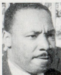
Zum «Erinnern Sie sich noch?» aus Heft 6/95

Aus den richtigen Antworten ziehen wir fünf Gewinner, unter welchen wir einen Blumenstrauß (gestiftet von Winterthur Leben) und vier Abonnemente der Zeitlupe zum Weiterverschenken verlosen.