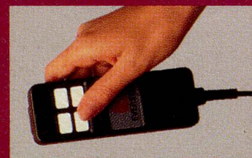
Das elektrische Steuergerät (auf Wunsch).