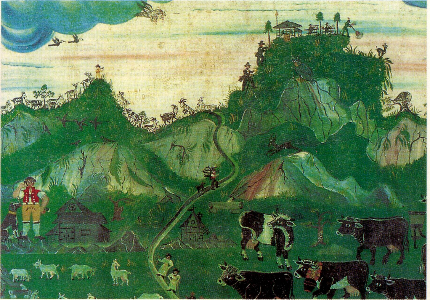
Bartholomäus Lämmli, «Die Ansicht der Kammohr, der Hohe Kasten und Staubern», 1854 (Originaltitel des Malers). Lämmli darf ohne Übertreibung bis heute als genialster unter den Bauernmalern bezeichnet werden.