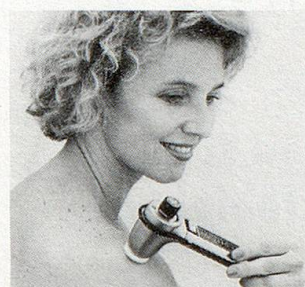
Modell SK2 (100–8000 Schwingungen/Sek.)

Unzählige Menschen jeden Alters in über 15 Ländern greifen in solchen Momenten ganz einfach nach dem NOVAFON-Schallwellengerät. Es bringt ihnen Entspannung, Linderung und Wohlbefinden.