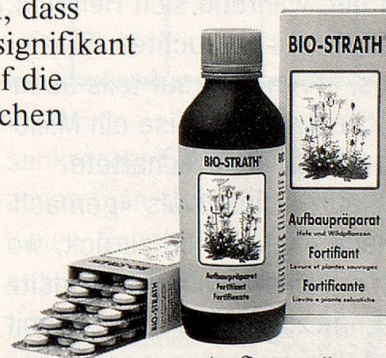
Aufbaupräparat Hefe und Wildpflanzen

BIO-STRATH hilft bei Müdigkeit, stärkt die Widerstandskraft und erhöht die Vitalität. In einem kontrollierten wissenschaftlichen Versuch ist kürzlich festgestellt worden, dass BIO-STRATH einen signifikant positiven Einfluss auf die physischen, psychischen und mentalen Leistungen hat.