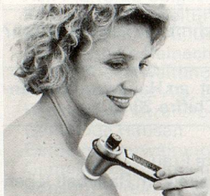
Modell SK2 (100–8000 Schwingungen/Sek.)

Unzählige Menschen jeden Alters in über 15 Län- dern greifen in solchen Momenten ganz einfach nach dem NOVAFON-Schallwellengerät. Es bringt ihnen Entspannung, Linderung und Wohl- befinden.