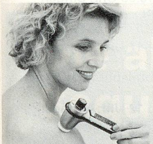
Modell SK2 (100–8000 Schwingungen/Sek.)

Unzählige Menschen jeden Alters in über 15 Ländern greifen in solchen Momenten ganz einfach nach dem NOVAFON-Schallwellengerät. Es bringt ihnen Entspannung, Linderung und Wohlbefinden.