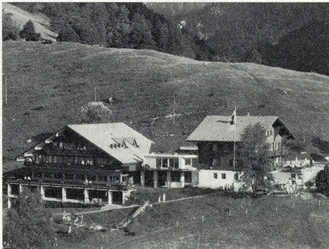
Blaukreuzheim Aeschiried 3703 Aeschi ob Spiez