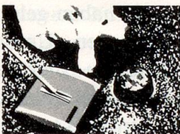
HOKY schluckt alles: Brosmen, Fusseln, selbst Hunde- und Katzenhaare.