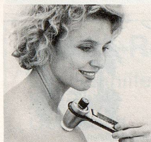
Modell SK2 (100–8000 Schwingungen/Sek.)

Unzählige Menschen jeden Alters in über 15 Ländern greifen in solchen Momenten ganz einfach nach dem NOVAFON-Schallwellengerät . Es bringt ihnen Entspannung, Linderung und Wohlbefinden.