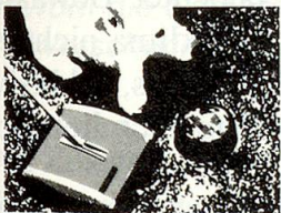
HOKY schluckt alles: Brosmen, Fusseln, selbst Hunde- und Katzenhaare.