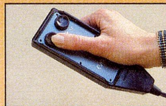
Das elektrische Steuergerät (auf Wunsch).