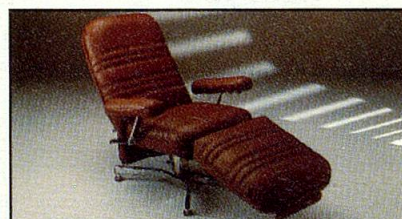
Everstyl „Trocadero“, zeitlos modern