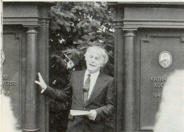
«Zwei sich Liebende konnten im Leben nicht zueinander kommen. Sie liessen sich dafür nebeneinander begraben und dokumentierten ihre Verbundenheit mit den gleichen Grabsteinen.»

dabei ist, dass er in der Zeit zu Hause ist, wo die von ihm beschriebenen Menschen lebten. Sie sind ihm wertvoll, er behandelt sie mit grosser Pietät, stellt auf den Führungen – beinahe unbemerkt – bei diesem Grab ein umgefallenes Blumenstöckchen wieder auf, wischt bei jenem einen Grabstein sauber.