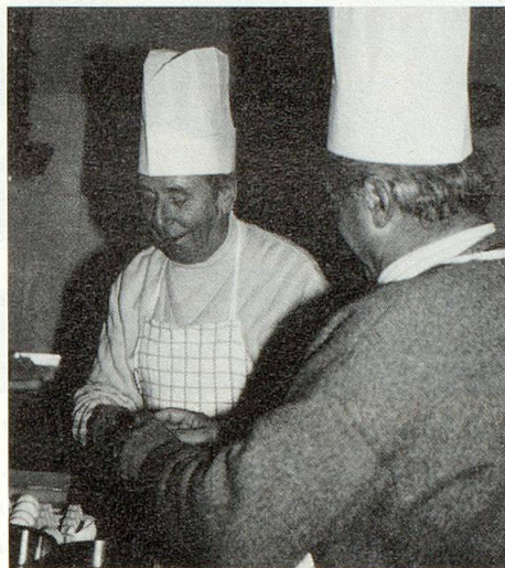
Kochenlernen ein Vergnügen

tonen Bern, Luzern, St. Gallen, Thurgau und Zug nahmen im Hotel «National» daran teil. Trotz Ausschreibung in der «Zeitlupe» hatten sich nicht mehr Teilnehmer eingefunden.