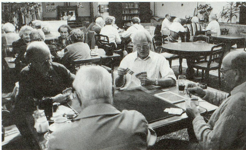
Am Montagnachmittag treffen sich die Jasserinnen und Jasser.