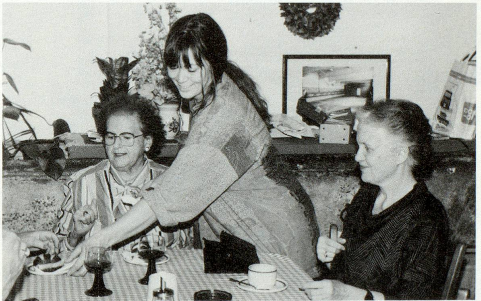
Der Mittagstisch: Meistens trifft man jemanden, mit dem man essen und auch plaudern kann.

lerateliers, eine Kinderkrippe, die Videogenossenschaft, ein Boxclub und das Kasernenschulhaus gehören ebenfalls dazu. So können Kontakte über Generationen hinweg zustandekommen.