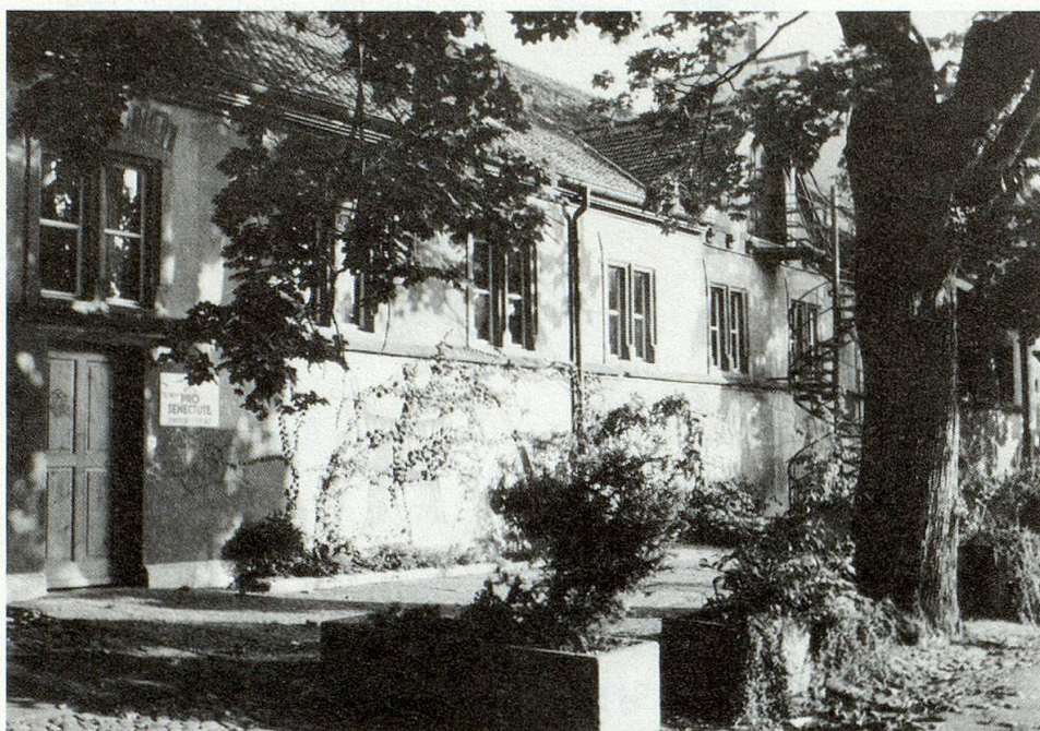
Der ehemalige Pferdestall der Basler Kaserne wird zum beliebten Seniorentreffpunkt.