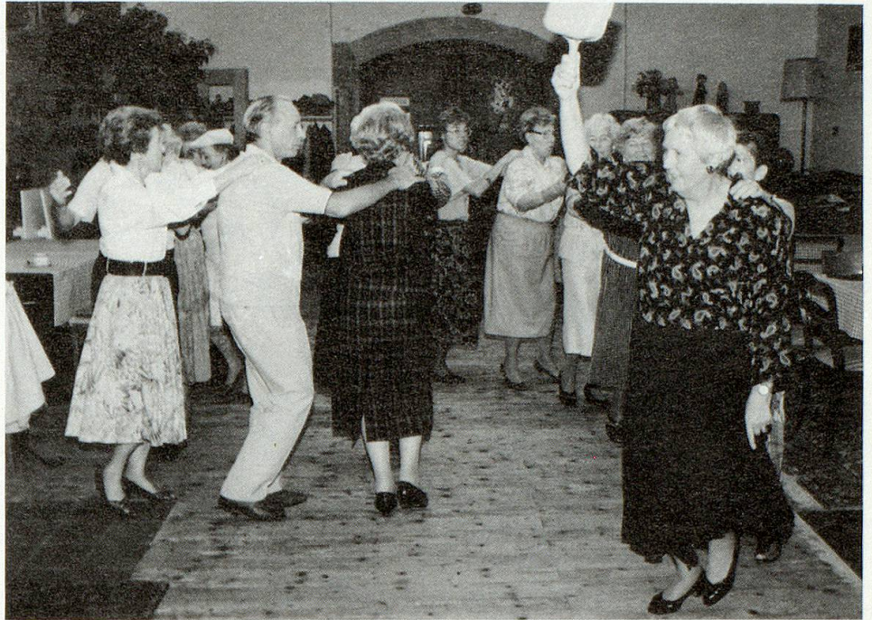
Einmal im Monat laden die Grauen Panther zum Tanz.

Aber nicht nur der Spiel-Estrich hat hier Unterkunft gefunden. Da gibt es noch das Kaffi Schlappe für Jugendliche, die Kulturwerkstätte, auch die islamische Gemeinde genießt hier Gastrecht. Viele Künst-