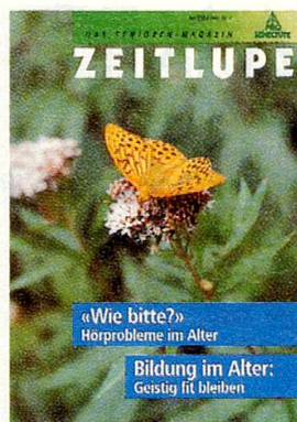
Der «Kaisermantel» (ZEITLUPE 2/91).

Es ermöglicht uns jedoch auch, ohne grosse Werbekosten auszukommen