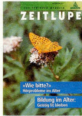
Der «Kaisermantel» (ZEITLUPE 2/91).

Es ermöglicht uns jedoch auch, ohne grosse Werbekosten auszukommen