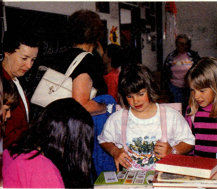
Es geht auch ohne Sprachkenntnisse, die Drittklässlerinnen fragen ihre Gäste aus.

Auf dem Rückweg im Bus und beim Mittagessen, das von den Männern des Herzbergs gekocht wurde, entwickelte sich ein lebhaftes Gespräch. Eigentlich wollte ich selber Fragen stellen, doch musste ich dauernd Auskunft geben. Auf dem Herzberg räumen die Gäste selbst die Tische ab. Wegen des Frauenstreiks war das Sache der Männer. Eine Frau bemerkte schmunzelnd, sie hätte ihren Mann heute zum