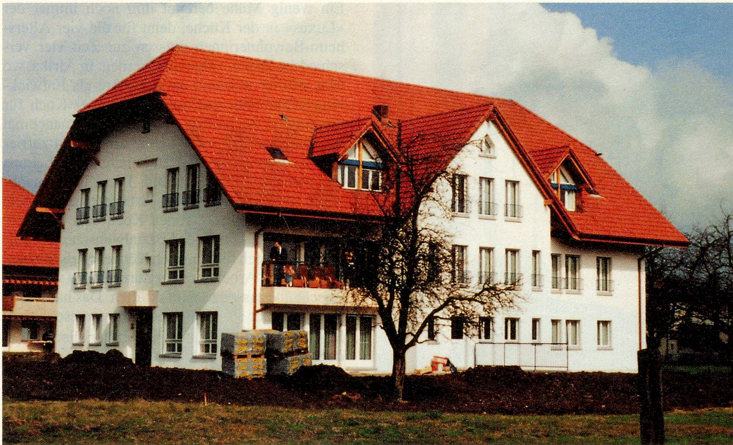
Ein gelungener Bau – noch sind die Umgebungsarbeiten nicht ganz beendet.

In den Pflegezimmern waren im März noch die Handwerker «zu Gast». Es fehlten – obwohl die Verzögerung auf den «Marschplan» nur kurz war – noch Kleinigkeiten, die das Leben angenehmer machen. An alles wurde gedacht: an genügend Kästen und Kästchen für Kleider und Wäsche, für liebgewordene Sachen und Säckelchen von «daheim»; an genügend Schalter für Licht, Radio, Fernsehen, an den Telefonanschluss. Damit die Zimmer wirklich persönlich (mit eigenen Möbeln) eingerichtet werden können, darf das moderne Pflegebett nach Wunsch plaziert werden, denn die einen schauen gern gegen das Fenster, andere drehen sich lieber zur Wand. Schall- und Wärme-Isolation und sogar Abschirmung gegen Elektromog erhöhen das Wohlbefinden. «Sicher», bemerkte am Eröffnungstag ein kritischer Besucher, «achtete man auch auf Erdstrahlen.» Selbstverständlich haben die Verantwortlichen das getan.