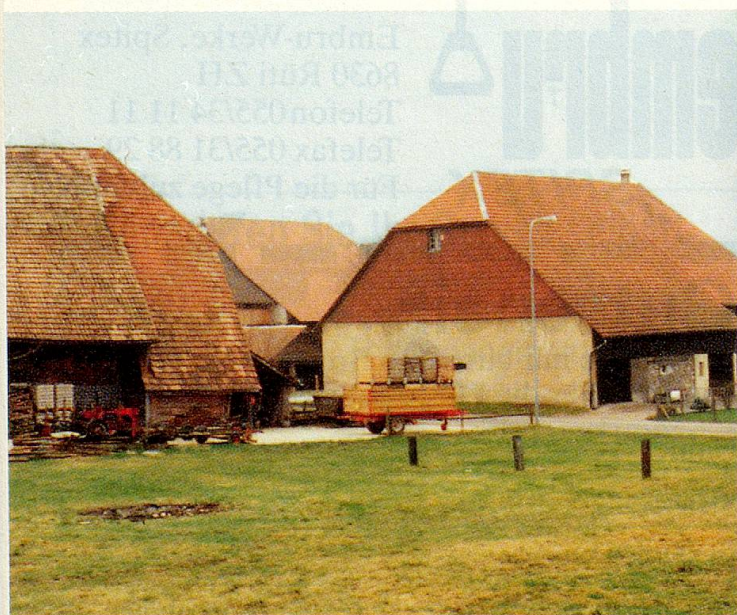
Diese behäbigen Bauernhöfe stehen in der Nachbarschaft der «Stapfenmatt.»

W er ein Leben lang vegetarisch gelebt hat, möchte sich im Alter nicht an ein Huhn im Topf, Geschnetzeltes mit Rösti oder eine Bernerplatte gewöhnen müssen. Wo aber wird auf die Bedürfnisse jener Rücksicht genommen, die an fleischloser, vollwertiger Ernährung festhalten möchten? Auf diese Frage gibt es jetzt eine klare Antwort: in der «Stapfenmatt» im solothurnischen Niederbuchsiten.