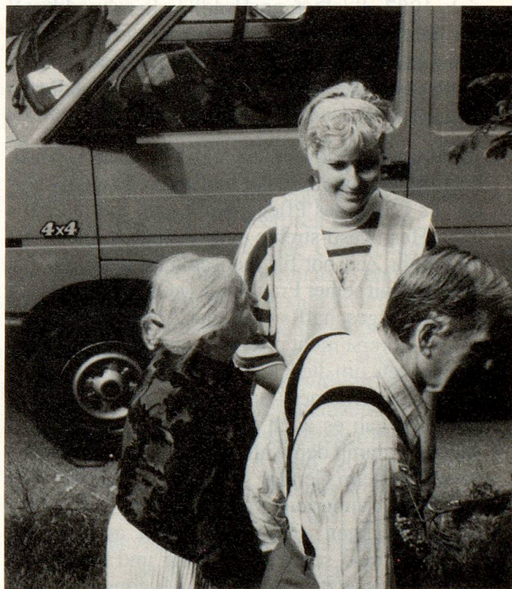
Hand in Hand kehrt das Paar vom kurzen Spaziergang zurück.