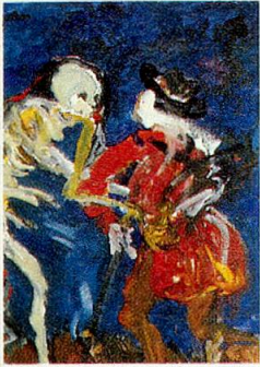
Titelbild: «Der Tod zum Krüppel», Acrylbild von Herwig Zens, aus dem Projekt Basler Totentanz, Historisches Museum Basel.

August/September 1990, 68. Jahrgang, Nr. 4