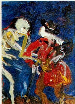
Titelbild: «Der Tod zum Krüppel», Acrylbild von Herwig Zens, aus dem Projekt Basler Totentanz, Historisches Museum Basel.

August/September 1990, 68. Jahrgang, Nr. 4