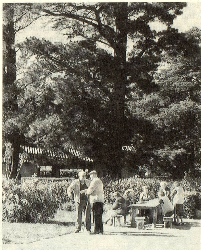
Das Funke-Haus liegt inmitten eines prächtigen Parks.

Überall beginnt sich das Leben zu regen. Um 8.30 Uhr fahren wir in die Station Sierra de la Ventana (Fenstergebirge) ein. Ich habe keine Ahnung, wie es weitergehen soll, aber einmal um die Ecke des Stationsgebäudes, und da steht die Lösung auf 4 Rädern: ein «Colectivo» (Bus), der uns in das «El Hogar Rodolfo Funke» bringen wird. Unser Chauffeur ist ein versierter Fahrer und Akrobat. Im Zickzack geht es um die grossen und tiefen Löcher der nicht asphaltierten Strasse. So schaukelt er uns 50 km weit an unser Ziel, wo wir nach einer Stunde eintreffen, herzlich empfangen von den anwesenden Gästen und