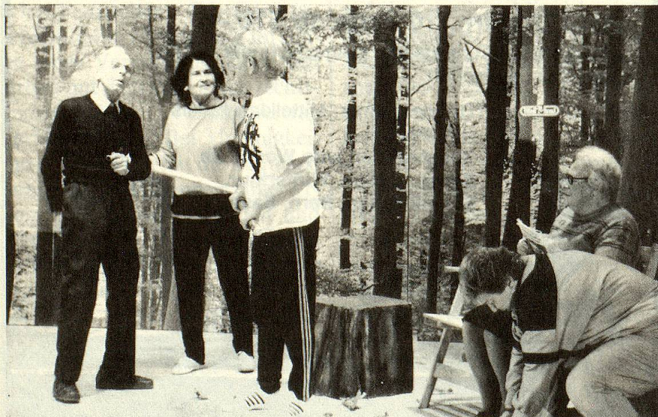
Fitness – Thema des St. Galler Senioren-Theaters.

Doch heute gehört die Töcherschule der Vergangenheit an: Die Schwestern sind älter geworden, der Nachwuchs durch junge Kräfte fehlte, schwindende Schü-