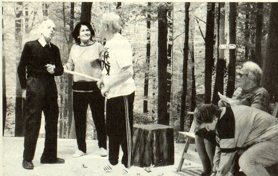
Fitness – Thema des St. Galler Senioren-Theaters.

Doch heute gehört die Töcherschule der Vergangenheit an: Die Schwestern sind älter geworden, der Nachwuchs durch junge Kräfte fehlte, schwindende Schü-