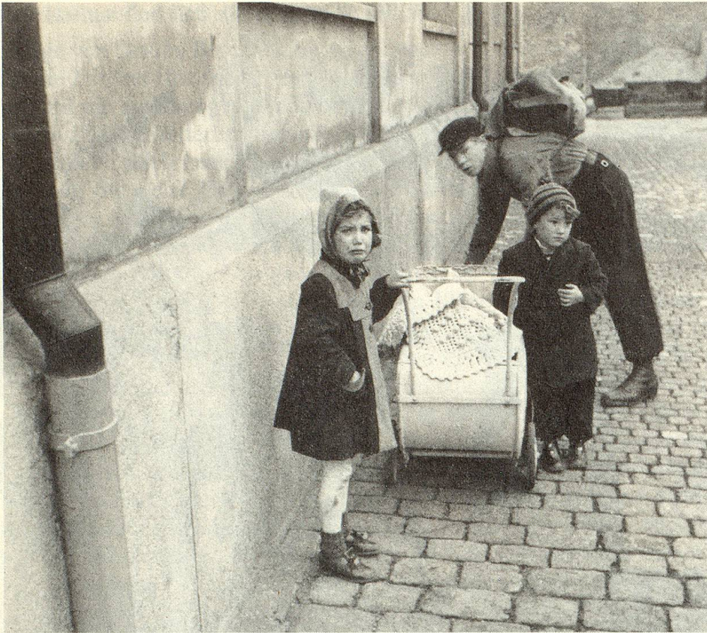
Kinder aus dem Elsass warten auf ihre Angehörigen, die sie nach Basel bringen werden, 1944.

bucheintrag lautet, sogar einen Anflug von Selbstanerkennung zu entlocken. «Ein bisschen stolz bin ich schon, dass ich mit diesem Buch der Nachwelt etwas hinterlassen konnte», sagt er zögernd und lächelt etwas verschämt und fast verlegen.