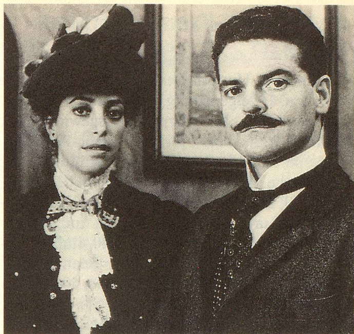
Bei Familienfeiern trugen die Frauen früher lange Roben, die Männer den steifen Kragen. Die Tante des Täuflings hatte sich zum festlichen Anlass sogar mit einem Hut geschmückt: Tante und Onkel wissen um den Ernst der Stunde.

So lässt Scola 80 Jahre Familiengeschichte vorbeiziehen. Ungewöhnlich ist, dass er immer in den Räumen dieser grossen, weitläufigen Wohnung bleibt. Die Welt – das Weltgeschehen müsste man eher sagen – dringt von aussen ein, durch Erzählungen von heimkehrenden Angehörigen, durch das Telefon, später über Radio und Fernsehen. Scola erlaubt seiner Kamera in keinem Moment, die Wohnung zu verlassen; ge-