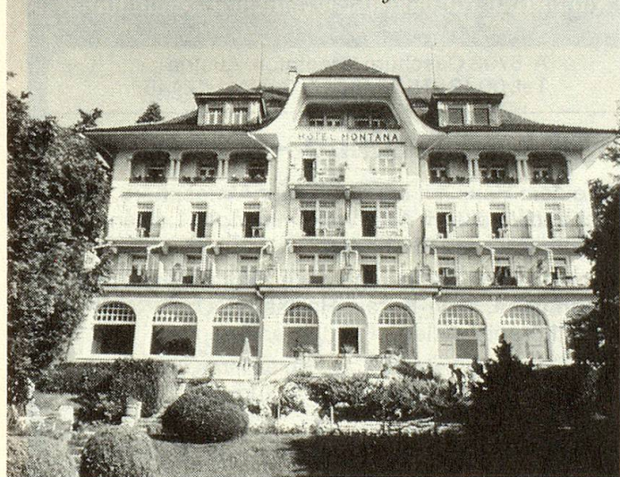
Parkhotel Montana in Oberhofen am Thunersee

Das sind die Preise für 1 Woche (6 Übernachtungen inkl. Halbpension) während der Hauptsaison (16. Juni bis 15. September):