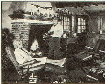
Behaglich – als leicht geneigter Fernsehsessel. Bequem – als flache Liege für unerwartete Gäste.