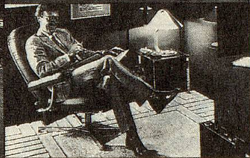
Körpergerecht – als Arbeitssessel ohne Fussstütze. Individuell einstellbar – eine Wohltat für alte und kranke Menschen.