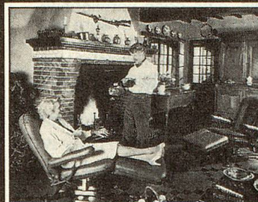
Behaglich – als leicht geneigter Fernsehsessel. Bequem – als flache Liege für unerwartete Gäste.