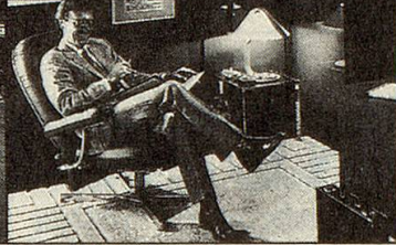
Körpergerecht – als Arbeitsessel ohne Fussstütze. Individuell einstellbar – eine Wohltat für alte und kranke Menschen.

Unverwundliches Gestell aus geschweisstem Stahlrohr.