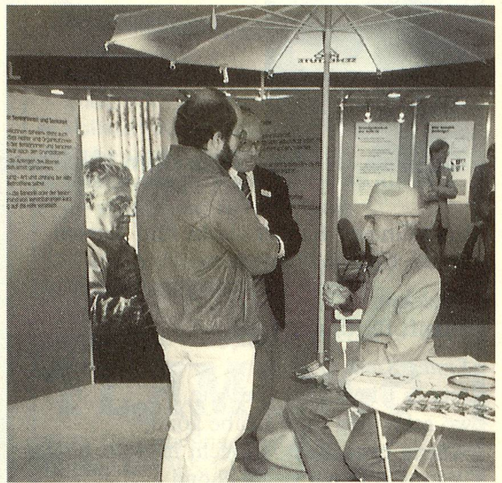
Die Sitzgelegenheiten waren höchst willkommen, es tat gut, die müden Füsse ausstrecken zu können. Foto es

Erstmals beteiligte sich Pro Senectute in diesem Jahr mit einem Informationsstand an der OLMA, der Schweizer Messe für Land- und Milchwirtschaft. Schrifttafeln, Bilder, Prospekte und eine Fernseh-Tonbildschau machten auf die mannigfachen Dienstleistungen unserer Stiftung aufmerksam, wobei aus naheliegenden Gründen das Angebot und die Möglichkeiten in der Stadt und im Kanton St. Gallen hervorgehoben wurden. Einen weiteren thematischen Schwerpunkt bildete das Wohnen daheim.