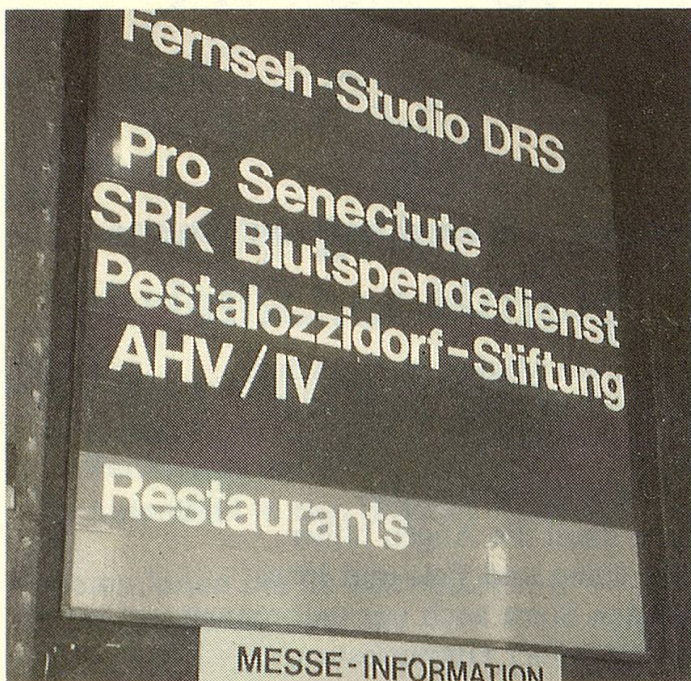
Der Pro Senectute-Stand am Eingang zur Halle D war nicht zu übersehen.