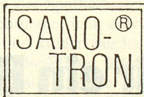
+ PATENT ANGEN.