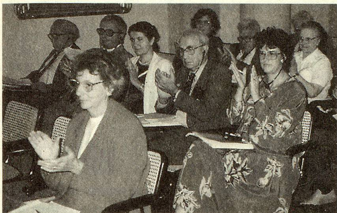
Beifall der Abgeordnetenversammlung nach dem Referat von Prof. Ursula Lehr.