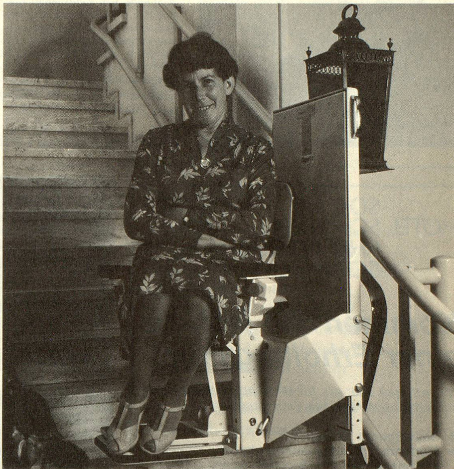
TLG Treppenlift in einem Einfamilienhaus

TLG Treppenlifte werden in der Schweiz hergestellt. Dank den verschiedenen Regionalvertretungen und Servicestellen in der ganzen Schweiz ist der zuverlässige Betrieb und der tadellose Unterhalt gewährleistet.