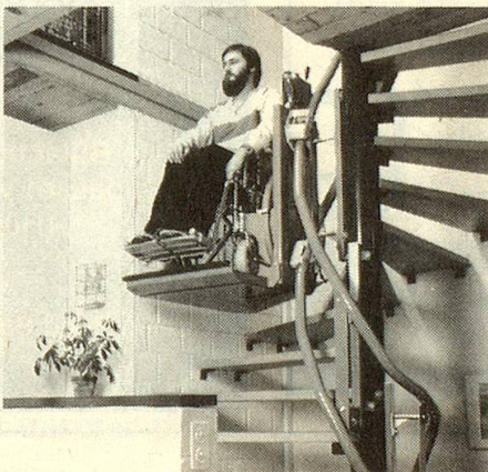
Wendeltreppe mit TLG Treppenlift und Rollstuhl-Plattform