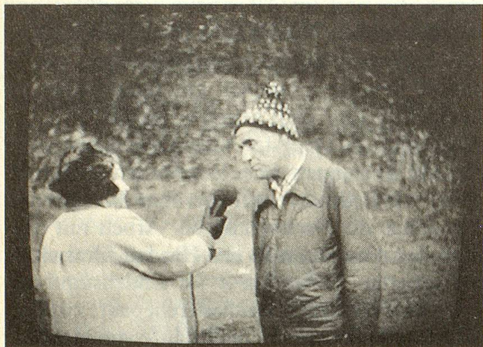
Ein Mann, kurz vor der Pensionierung, wird von einer ebenfalls betagten Frau über seine Zukunftspläne interviewt.

Während des ganzen Jahres 1983 arbeitete die Gruppe, jetzt etwa ein halbes Dutzend Junge und ebenso viele Alte, weiter. Sie hatten sich für das Thema Pensionierung entschieden. Ein halbes Jahr wurde diskutiert und recherchiert. Ein halbes Jahr wurden Aufnahmen gemacht und geschnitten. Es entstand ein 45minütiger Dokumentar-Spielfilm.