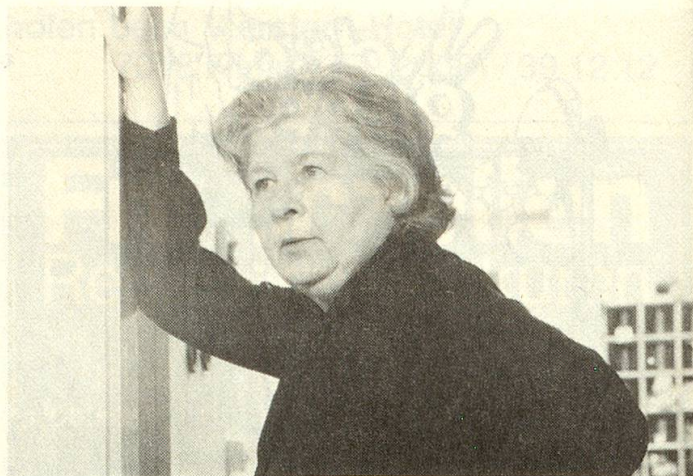
«Frau Amann, Witwe, 58»: Der erste Spielfilm der Gruppe alter und junger Betroffener handelt von den Sorgen und Problemen, aber auch den neuen Hoffnungen einer eben verwitweten Frau.

ist vielerorts auch spürbar. Doch habe ich bei dieser wie andern verwandten Altersgruppen die Erfahrung gemacht, dass der «pädagogische Zeigefinger» vielleicht auch verstanden werden kann als ihre Form des Engagements: Betagte wollen ihre während eines langen Lebens gemachten Erfahrungen weitergeben. Und sie tun es eben ganz! Vielleicht ist das eine heutige Form der vielzitierten «Weisheit des Alters».