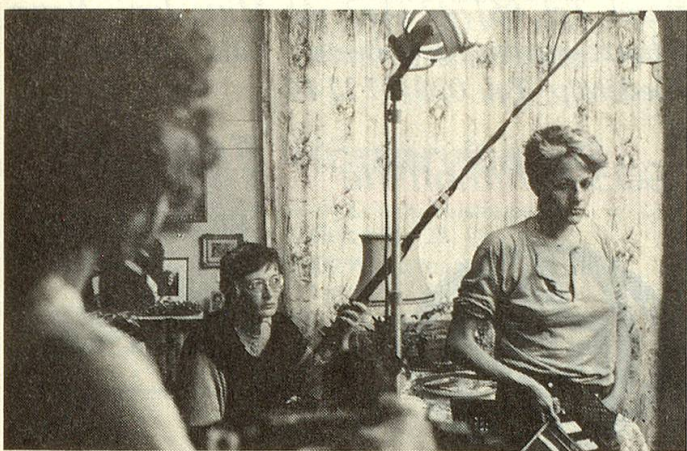
Junge Menschen am Mikrophon und an der Klappe; Junge, die sich während Monaten mit den Problemen Betagter auseinandersetzen.