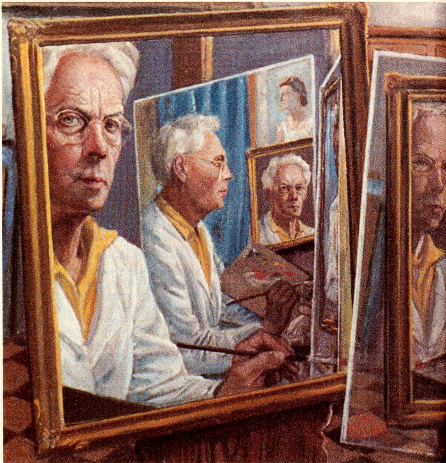
Ein interessantes Selbstbildnis aus jüngeren Jahren. Der Künstler hörte nie auf, sich zu beobachten.