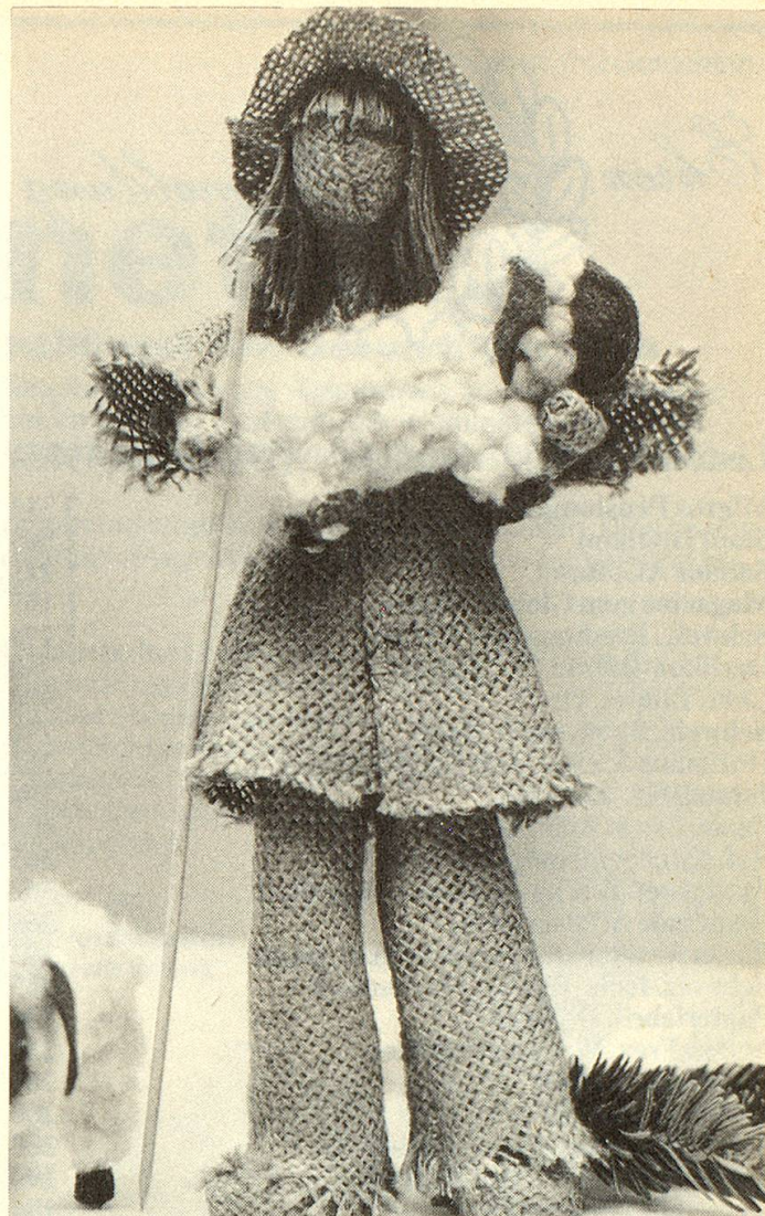
Aus einem Stück Draht, Jute, etwas Wolle und Holz entstand ein Hirte.