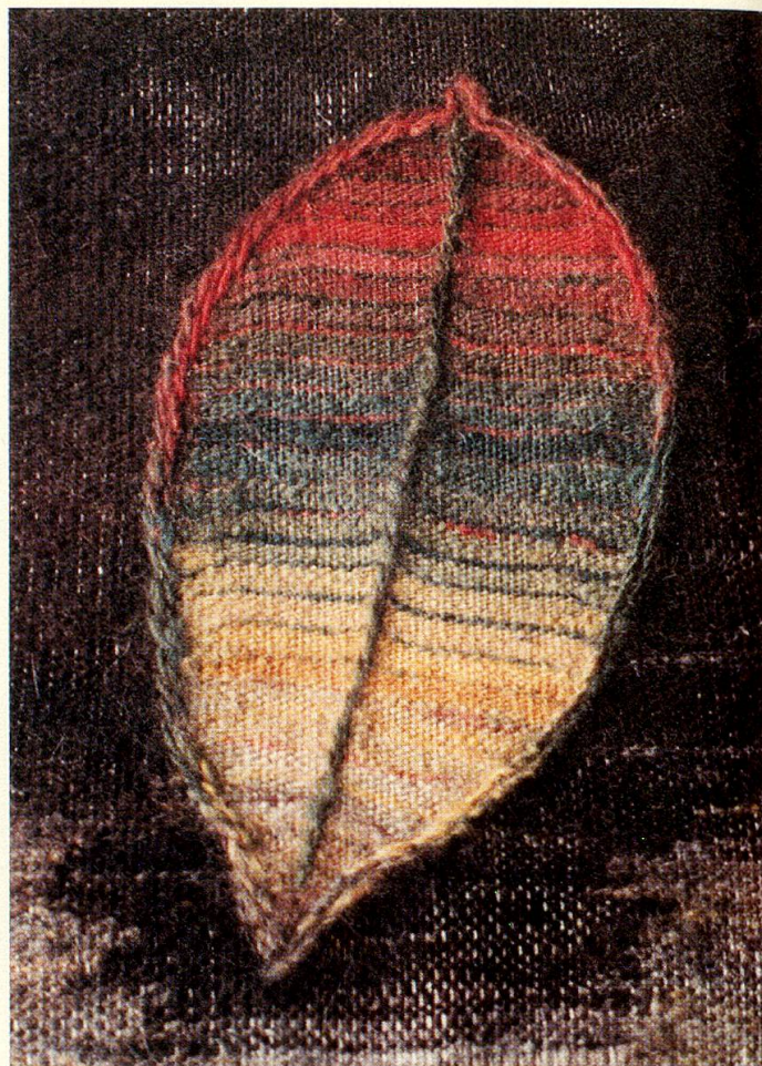
Durch die ausgeklügelte Verbindung von Weben und Sticken wirkt das Blatt ganz natürlich.

Die Eltern wohnten in Männedorf in einem recht grossen Haus mit viel Umschwung, an Arbeit fehlte es der einzigen Tochter nicht. Für sie war es selbstverständliche Pflicht, ihre Mutter zu betreuen. Dreiunddreissig Jahre dauerte diese Hauspflege... Ein einziges Mal konnte sie vier Wochen in Italien verbringen, Abwechslung hatte sie nur, wenn sie während der strengsten Zeiten bei den Bauern der Umgebung helfend einspringen konnte. Viele Menschen würden