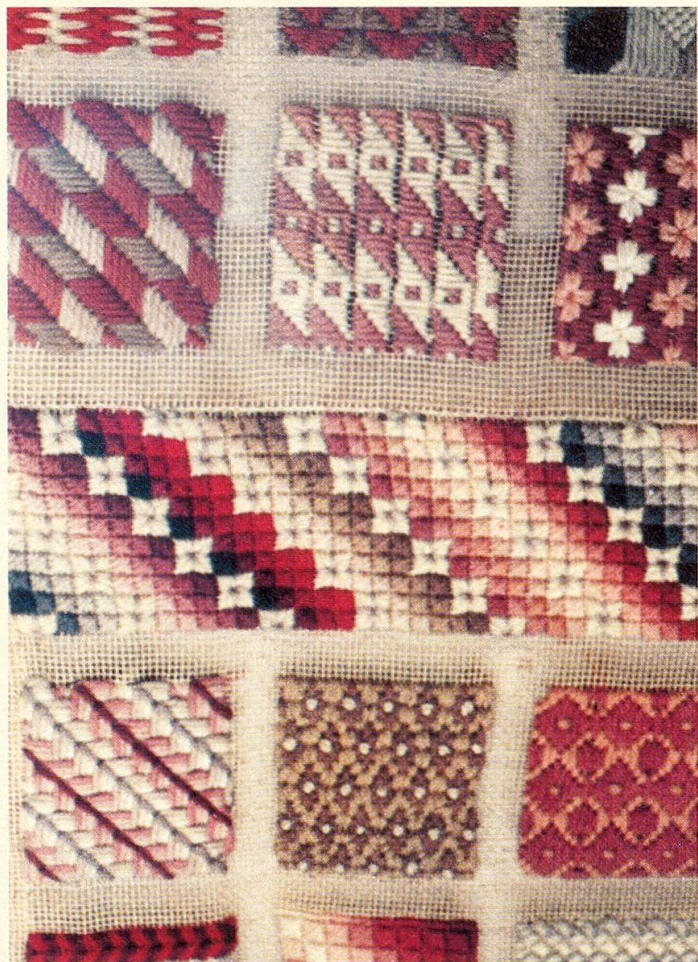
Ein Teil des Strickmustertuches der Urgrossmutter, eines Prunkstückes der Ausstellung.

Jahre später zog sie mit den Eltern nach Basel, die Umstellung wiederholte sich. Ein kurzer Aufenthalt auf dem Land entschied ihre Berufswahl, sie wollte Gärtnerin werden. Zwei Jahre dauerte die Ausbildung in der ehemaligen Gartenbauschule in Estavayer. Dann fand sie eine Stelle bei einem Gärtner in Basel und verdiente anfänglich in der Stunde einen ganzen Franken, eine Summe, die sie mit Stolz und Freude erfüllte. Lange konnte sie sich nicht des eigenen Einkommens erfreuen. Nach knapp drei Jahren musste sie die Pflege ihrer kränklichen Mutter übernehmen, die der Vater nicht mehr allein bewältigen konnte.