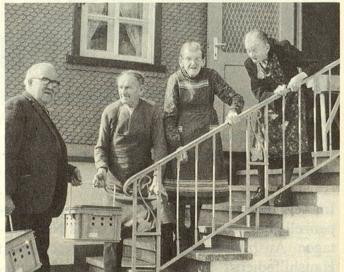
Freudig werden die franko Haus gelieferten Mahlzeiten in Empfang genommen.