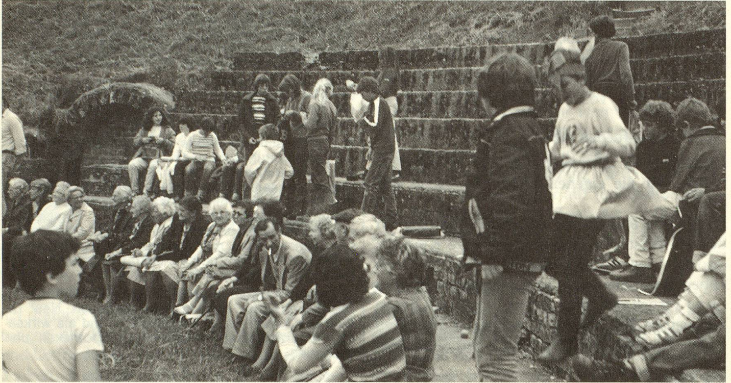
Die Wetziker Sechstklässler als «Fremdenführer» der Senioren im Amphitheater von Avenches.