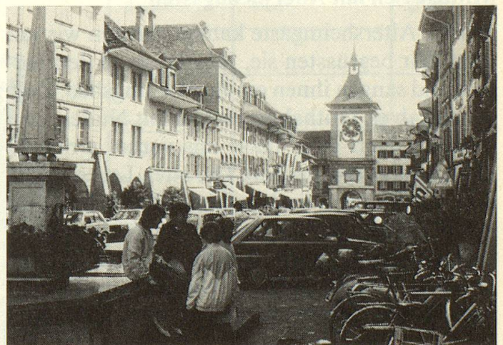
Blick in eine der malerischen mittelalterlichen Strassen von Murten.