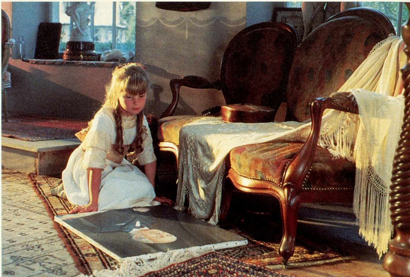
Bewunderung für das Schaffen des Grossvaters.