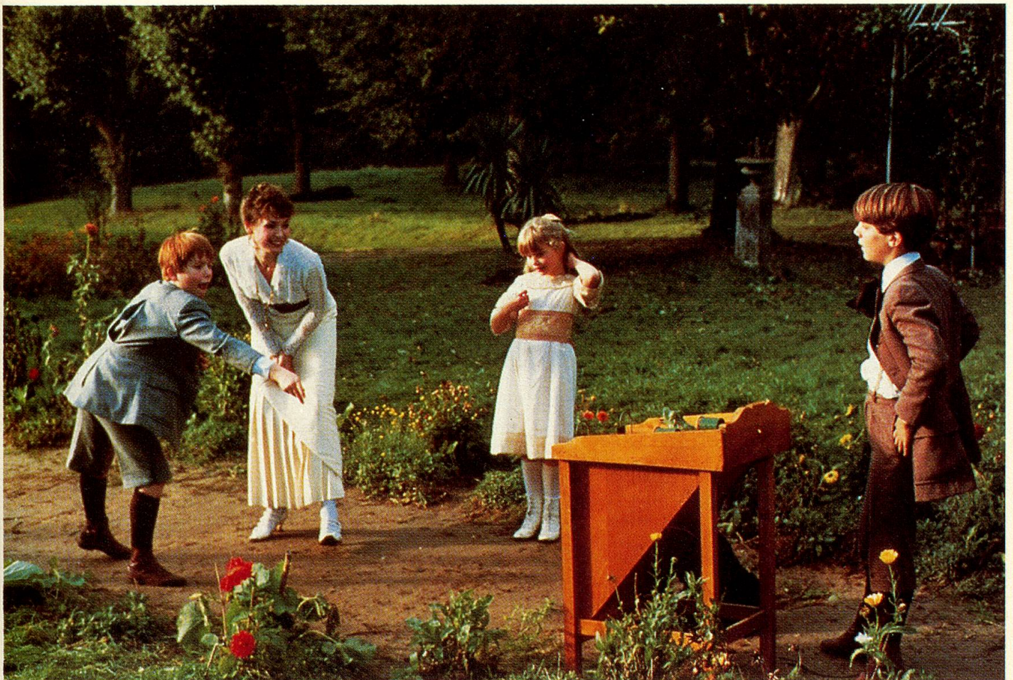
Beglückendes Spiel mit der extravaganen Tante.

Er ist ein Maler seines Gartens, seiner kleinen Welt, seines kurzen Lebens. Zählt man seine Jahre, ist es lang, glaubt man seinen Träumen, ist alles erst gestern gewesen.