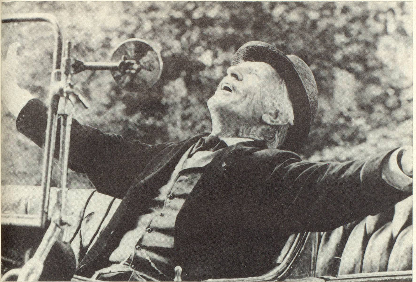
Wiedersehen mit dem Land der Erinnerungen.