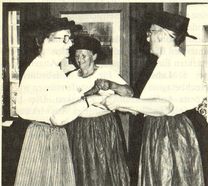
Beim Mittagessen erfreuten Altersturnerinnen aus Kernenried in alten Bernertrachten die Gäste.