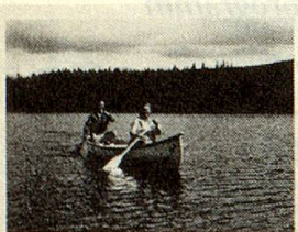
Elisabeth Hunzinger FRÜHLING IM HERBST Eine Grossmutter und der kanadische Traum ZYTGLOGGE