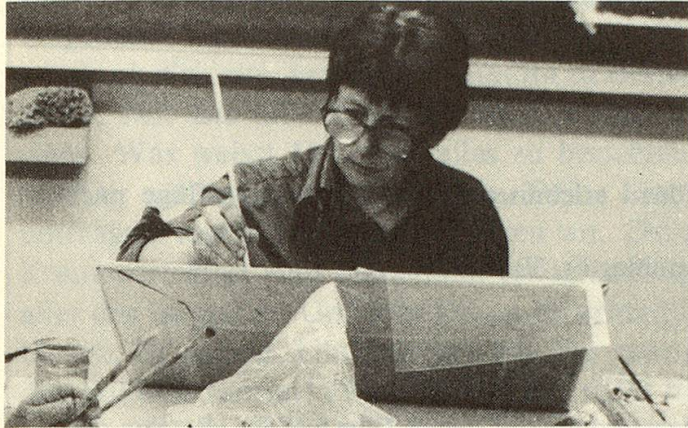
Volle Konzentration im Malkurs.

lich, dass dieses Modell auf unbestimmte Zeit von einer privaten Unternehmung finanziell getragen wird. Die Stifterfirmen verstehen diesen Beitrag im Sinne des sozialen Mäzenatentums. Es wäre durchaus denkbar, dass der Staat oder die Gemeinde, also die öffentliche Hand, Träger einer solchen Begegnungs- und Bildungsstätte ist; entsprechende Modellnachahmer haben sich im In- und Ausland finden lassen. Wir haben mit über 400 Referaten über unsere Arbeit weit über die Schweizer Grenzen hinaus berichten können und freuen uns über die Ausstrahlung.