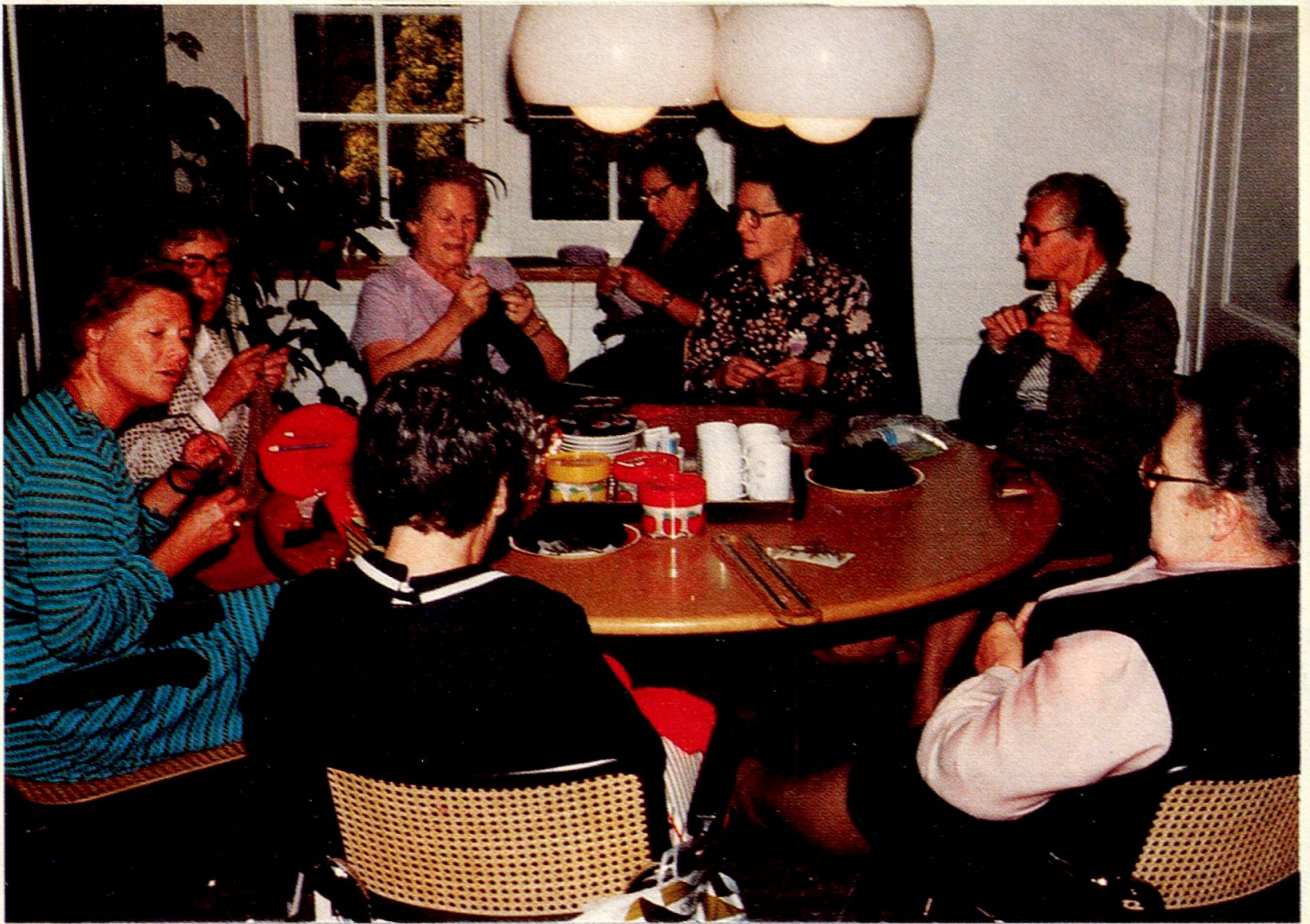
Gemütliche Strick- und Plauderrunde. Lektüre in der Stadthausstube.